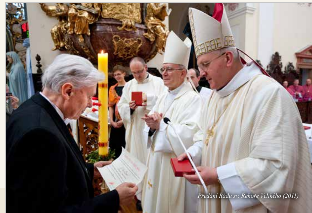
Předání Řádu sv. Řehoře Velikého (2011)

Ano. A kdybych měl znovu žít, nechtěl bych dělat nic jiného. Mohl jsem pracovat dlouhé roky na jednom místě. Měl jsem několik výborných kamarádů lé-