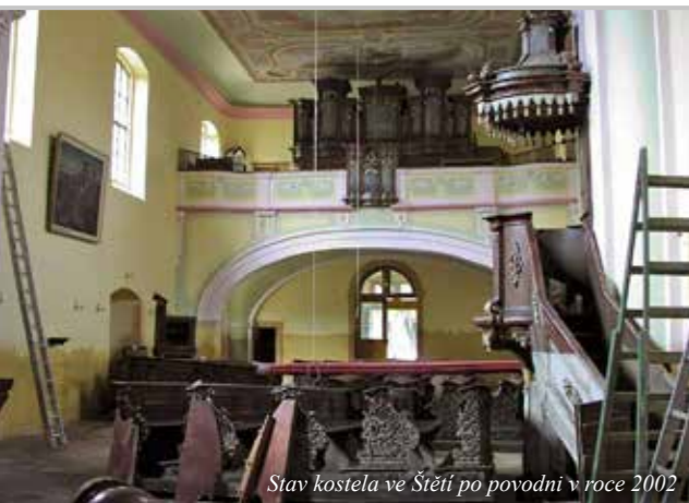
Stav kostela ve Štětí po povodni v roce 2002

První kostel je zde doložen již v roce 1300, prvním známým farářem zde byl kněz Jiří, který zemřel roku 1377. Původní podobu kostela neznáme, víme ale, že byl v roce 1620 vypleněn a zničen. S obnovou kostela započal v roce 1626 hrabě Vilém Slavata. Na zdejším zvonu Salvátor můžeme číst český nápis, upomínající na tuto událost. Tento kostel byl menší než je ten současný, jeho základy se nacházejí pod dnešní stavbou, což bylo objeveno při ničivé povodni v roce 2002. Původní „Slavatovský“ kostel byl zcela zničen při jarní povodni roku 1784, kdy