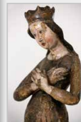
Fotografie na titulní straně časopisu: Jana Chadimová Panna Maria v naději, oltář z Duban (k textu na straně 14)

Fotografie bez uvedení autora Jana Michálková a Miroslav Zelenka