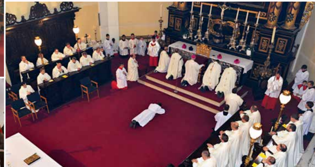
K textu na straně 14