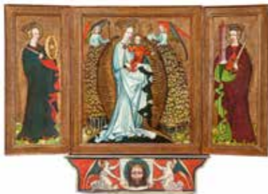
Oltář z Duban.