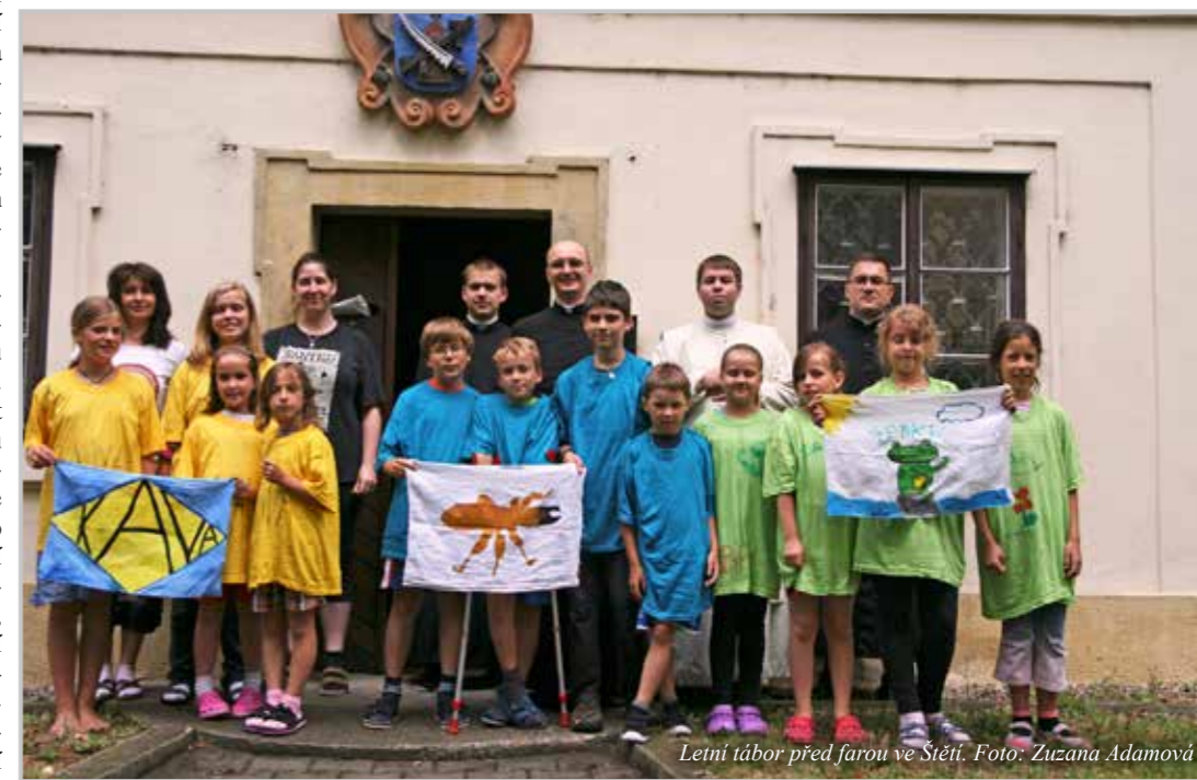
Letní tábor před farou ve Štětí.