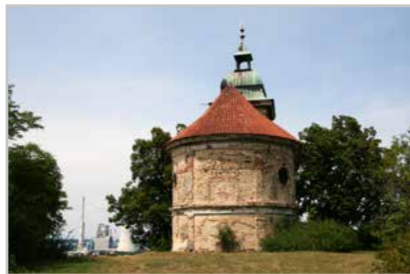
Kostel Božího hrobu v Liběchově, v pozadí elektrárna.

a Pavla darována tehdy nově založenému klášteru Benediktýnů v Břevnově. Dnešní podoba chrámu svatého Petra a Pavla je z roku 1783, kdy byl postaven kostel podle návrhu Kiliána Ignáce Dietzenhofera a byl financován Karlem Hubertem Pachtou z Rájova. Právě sem dojížděli věřící po dva roky, když byl kostel ve Štětí opravován po povodni v roce 2002. Druhým městečkem tohoto farního obvodu je Hoštka, farnost, ke které náleží obce Čakovice, Kochovice, Malešov a Velešice. V Hošce jsou kostely dva: malebný kostel Nanebevzetí Panny Marie, který dnes patří obci, ale kde se pravidelně slouží mše svatá a kostel sv. Otmara, který byl v sedmdesátých letech minulého století „zmodernizován“ ne právě šťastně. Až na pár výjimek bylo veškeré zařízení kostela zničeno, včetně pěti oltářů a kazatelny. Vše, co v kostele zůstalo, bylo natřeno na bílo, i podlaha a kříž, takže místní přezdívali tomuto prostoru „pítevna“. Přestavěna a tudíž zničena byla i barokní budova fary. Dnes