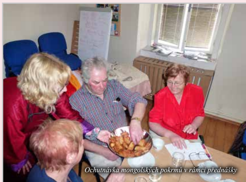
Ochutnávka mongolských pokrmů v rámci přednášky