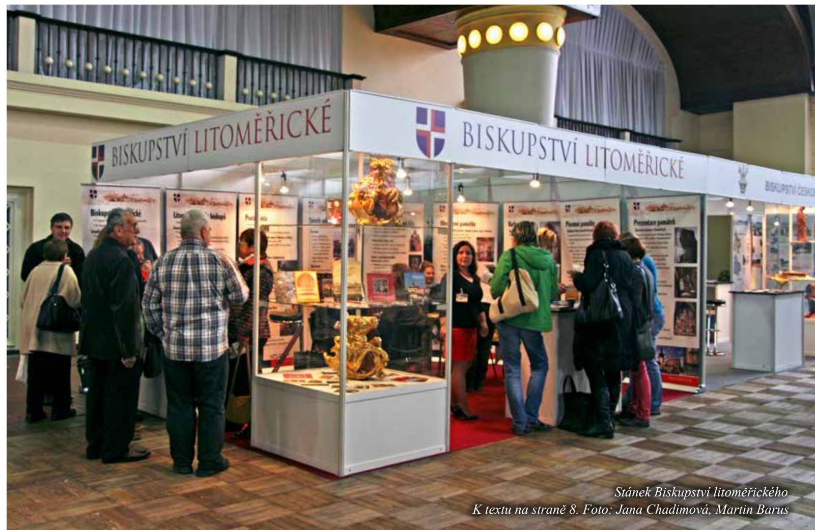
Stánek Biskupství litoměřického K textu na straně 8.