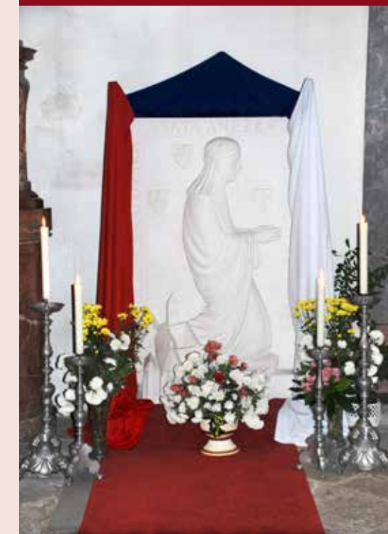
Reliéf sv. Anežky, klášterní kostel v Doksanech