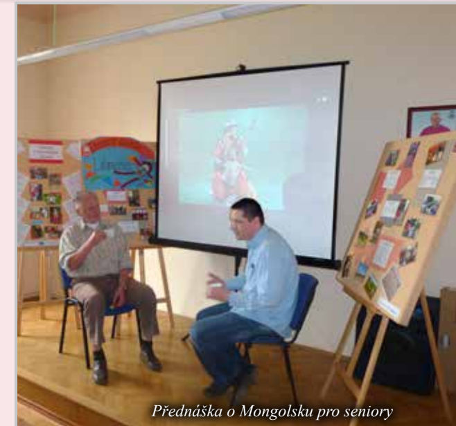
Přednáška o Mongolsku pro seniory