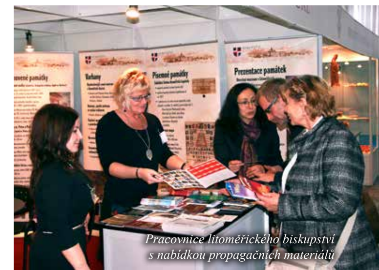
Pracovnice litoměřického biskupství s nabídkou propagačních materiálů