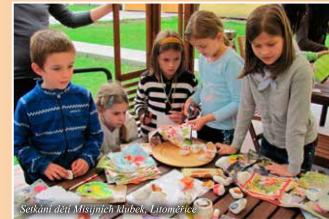
Setkání dětí Misijních klubek, Litoměřice