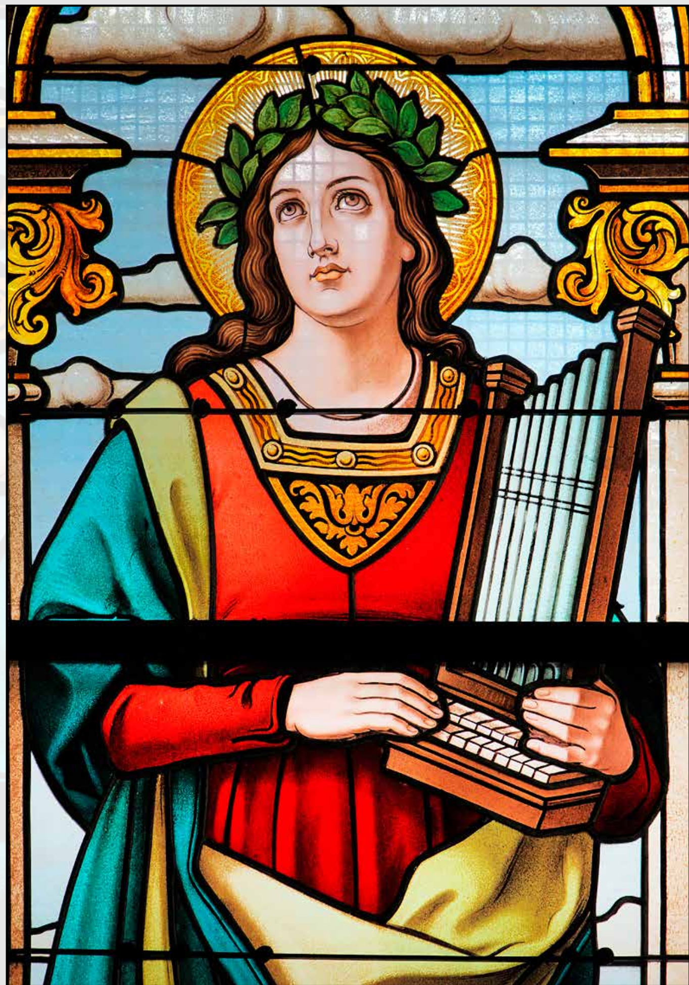
Sv. Cecílie, panna a mučednice vitráž kostela Nanebevzetí Panny Marie v Krupce 22. listopadu, památka