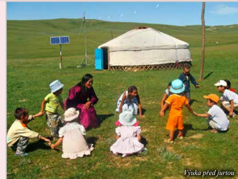
Výuka před jurtou

V rámci projektu Dali–Křídlo pořádá besedy o životě v Mongolsku a zároveň tak představuje zmiňovaný projekt. Každá beseda je uvedena filmem „Jeskyň žlutého psa“, který vznikl ve spo-