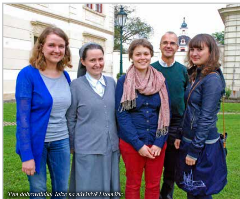
Tým dobrovolníků Taizé na návštěvě Litoměřic

Přijmout u sebe doma mladé lidi může být jedním z nejhezčích způsobů, jak se setkání zúčastnit. Mladí účastníci (většinou ve věku 17–35 let) si přivezou spacáky a karimatky. Potřebují jenom jednoduchou snídani. Po snídani odjedou a okolo 22. hodiny se zase vrátí. 1. ledna můžete pozvat své hosty na oběd. Vřelé přijetí je o tolik důležitější než luxus!