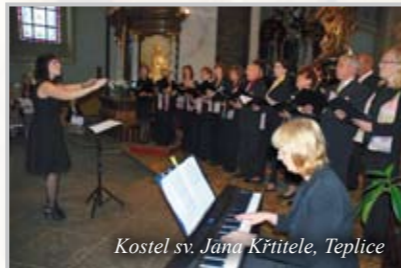
Kostel sv. Jana Křtitele, Teplice

„V litoměřických kostelech vládla úžasná atmosféra. Mezi pořadatelé spousta mladých lidí - líbil se nám nápad s fazolkami (za každého návštěvníka jedna). Program jsme si moc neužili, nemáme auto, poslední autobus z Litoměřic jel ve 21 hodin, ale i tak zážitky. Líbila se nám moderně pojatá modlitebná Církev adventistů sedmého dne, pravoslavný Sv. Václav, starobylá Sv. Ludmila, překrásný výhled na České středohoří ze zvo-