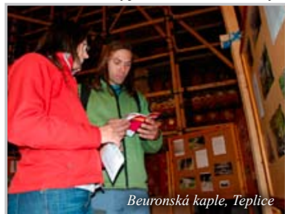
Beuronská kaple, Teplice

Zajímavé programy respektující sakrální prostor, osobní nasazení a vstřícný přístup pořadatelů a přítomnost kněží, s nimiž si mohli návštěvníci na místě promluvit - to vše přispělo ke zduaru akce. Z ohlasů a pochvalných vyjádření lidí z různých koutů naší diecéze (ať již návštěvníků, či pořadatelů) lze soudit, že Noc kostelů byla pro mnohé krásným zážitkem.