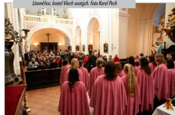
Litoměřice, kostel Věš svatých.