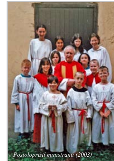
Postoloprtský ministranti (2003)

Všechny opravené kostely přijel pan biskup Josef Koukl vysvětit - a byly vždy plné lidí. Jednou dokonce řekl, že kostel v Nehasicích je první opravený po roce 1989, ale že těžší bude pomoci lidem, aby do kostelů také začali chodit.