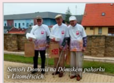
Seniori Domova na Dómském pahorku v Litoměřicích.