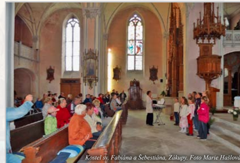
Kostel sv. Fabiána a Šebestiána, Zákupy.