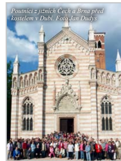
Poutníci z jižních Čech a Brna před kostelem v Dubí.