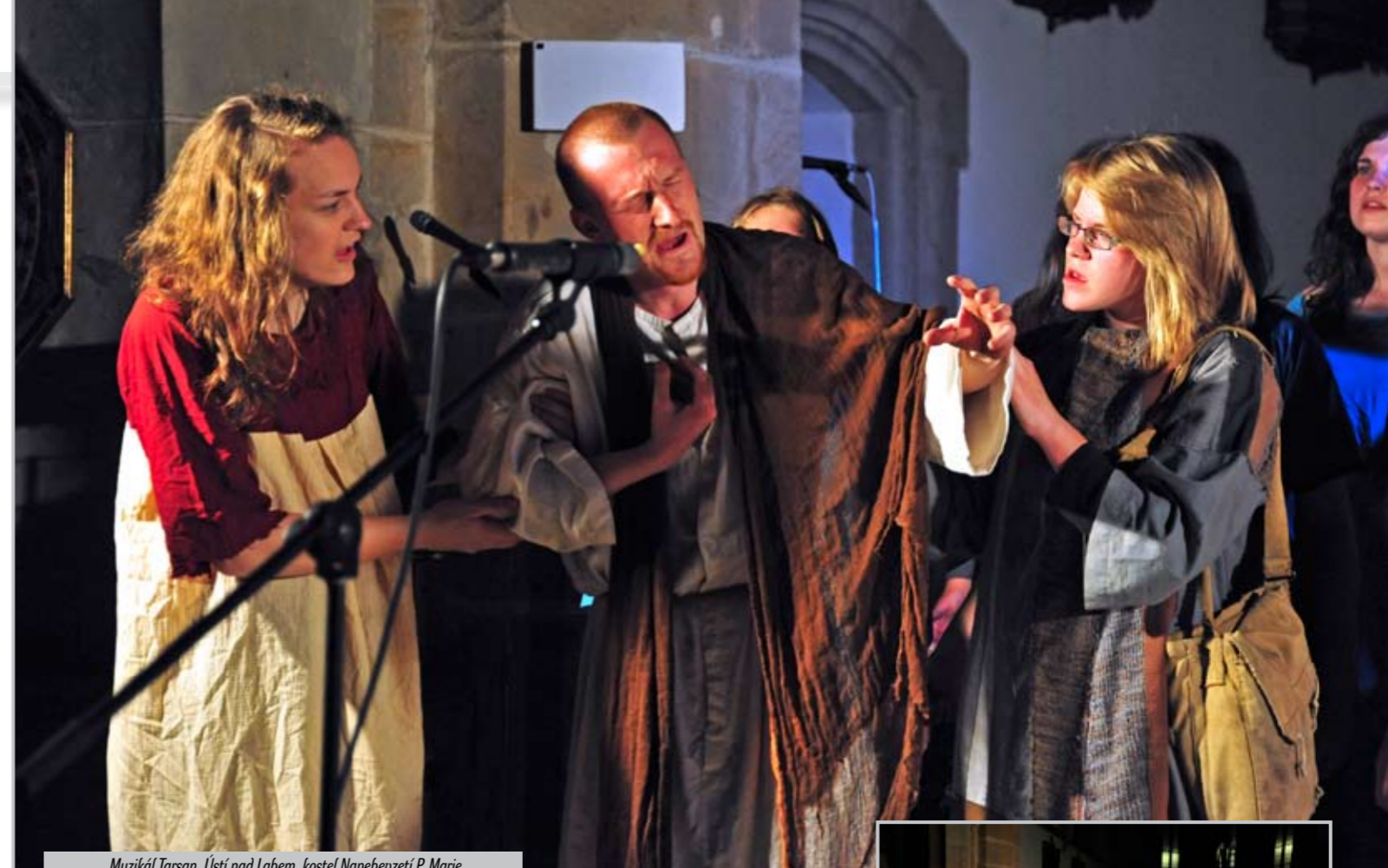
Muzikál Tarsan, Ústí nad Labem, kostel Nanebevzetí P. Marie.