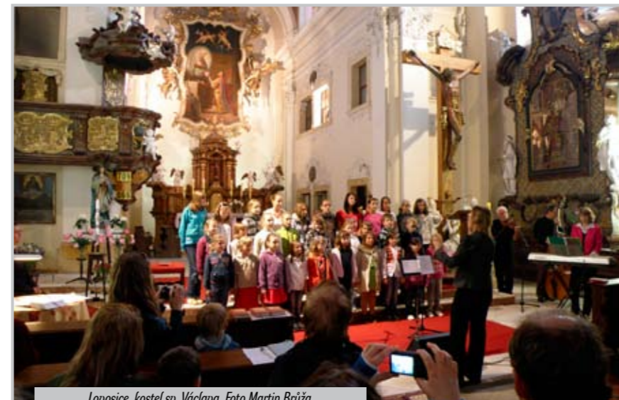
Lovosice, kostel sv. Václava.