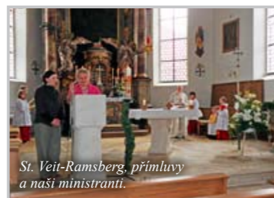
St. Veit-Ramsberg, přímluvy a naši ministranti.

Protože následující společná setkání s domácími farníky oficiálně probíhala pod hlavičkou KEB (Katholische Erwachsenenbildung – „katholické vzdělávání dospělých“), bylo třeba držet se předem dané struktury setkání. Každá z našich farností měla připravenou audiovizuální prezentaci, ve které informovala o svém fungování, organizaci a aktivitách. Následovalo obdobné představení hostící německé farnosti. Na základě toho, že jsme své prezentace připravovali podle předem formulovaných otázek, bylo pak možné jednotlivé informace lehko porovnávat a udělat si obrázek o tom, co mají naše farnosti společné a v čem se naopak lišíme.