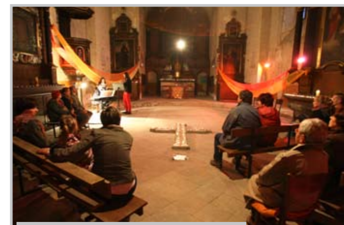
Litoměřice, kostel sv. Ludmily.