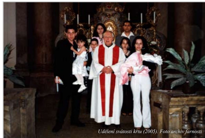
Udělení svátosti křtu (2005).