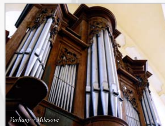
Varhany v Milešově

Znalci a obdivovatelé varhan jsou zvláštní skupina lidí. Celá řada z nich se téměř nazpaměť naučila zeměpis České republiky nikoliv podle průmyslových zón a přírodního bohatství, jak nás za starých časů učili ve škole, ale podle výskytu pozoruhodných varhanářských památek v té či oné oblasti. Před mnohým z nich stačí vyřknout třeba „Rab-