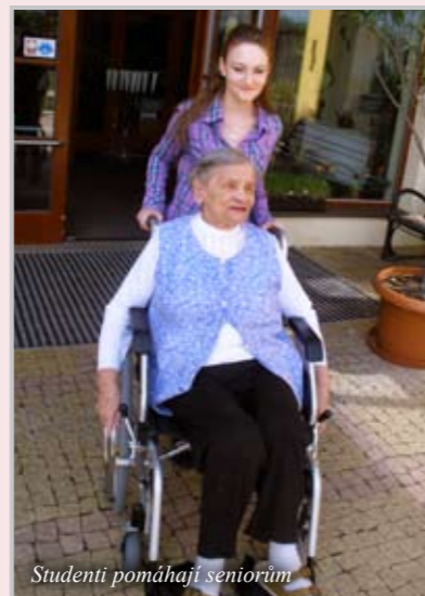
Studenti pomáhají seniorům

Dobrovolníkem se může stát ten, kdo má chuť dělat něco užitečného bez nároku na odměnu. Podmínkou je věk, dobrovolník musí být starší 15 let, mít čistý trestní rejstřík a vítané jsou vzdělání či zkušenosti potřebné k vybrané činnosti. Například pro mladé lidi může být učení seniorů tak běžným činnostem, jako pracovat s mobilním telefonem nebo počítačem, opravdovou výzvou.