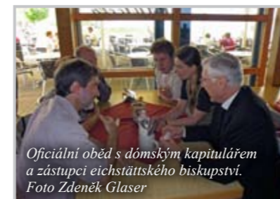
Oficiální oběd s dómským kapitulářem a zástupci eichstättského biskupství.

Ubytování jsme byli každý den v jiné rodině podle toho, kterou farnost jsme právě navštívili. I za tu poměrně krátkou dobu jsme se našimi hostiteli navázali krásná přátelství a ještě dlouho do noci po skončení programu doma diskutovali a povídali si o radostech i strastech života v našich farnostech.