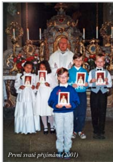
První svaté přijímání (2001)

Na teologickou fakultu jsem nastoupil v roce 1967. V druhém ročníku začali k nám do semináře přijíždět bohoslovci z Německa a ze Švýcarska a přivázeli nám spousty knížek. Říkali nám: „Vy jste tady skoro středověcí, daleko za námi!“ Sice jsem se dříve učil německy, ale udělal jsem si ještě osobní rychlokurz, abych mohl číst koncilní dekrety. Všechno ve volném čase, skoro tajně. Byl jsem čím dál víc koncilem nadšený. Profesori se o něm zmiňovali jen jakoby bokem, jako o něčem navíc, ale pro mě to bylo zásadní, i pro moji pozdější pastorační práci. Vzpomínám si, jak jsem v kostele vybudoval prosklenou zповědní místnost. I když stále byla možnost jít i do staré zповědnice, nakonec všichni chtěli do nové. Zažil jsem starou mši po dlouhá léta a ještě dnes, když prožívám novou, je to pro