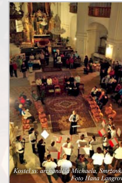
Kostel sv. archanděla Michaela, Smržovka.

Připravila Jana Michálková Fotogalerie na straně 23