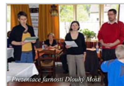
Prezentace farnosti Dlouhý Most.

Přestože byl program každého dne poměrně náročný a intenzivní, užili jsme si i chvíle klidnější: plavbu výletní lodí (jejímž majitelem a kapitánem byl jeden z členů zdejší farní rady) po jednom z uměle vytvořených jezer tohoto kraje, procházku historickým centrem Weissenburgu či Gunzenhausenu nebo oběd v malebné zahradní restauraci se zástupci diecézní rady v čele s dómským kapitulářem a bývalým generálním vikářem diecéze Eichstätt.