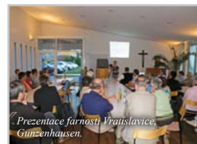
Prezentace farnosti Vratislavice, Gunzenhausen.

O skutečnosti, že se z obyčejných hostů a jejich hostitelů stali přátelé, jsme se přesvědčili při závěrečném společném loučení ve farnosti Hil-