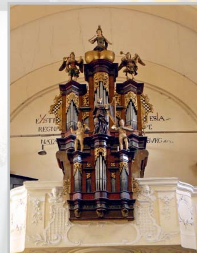
Varhany ve Velemíně