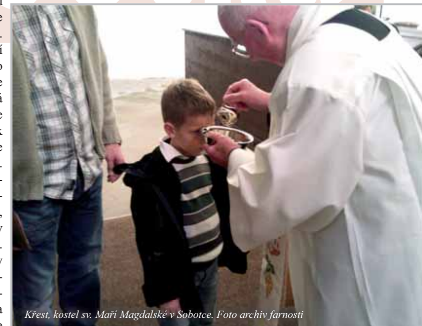
Křest, kostel sv. Maří Magdalské v Sobotce.

Zajímavá je i čtvrtá farnost Řitonic, která je ještě menší než Libošovice. Z vlastních Řitonic nechodí do kostela nikdo a podle děkana Maryšky