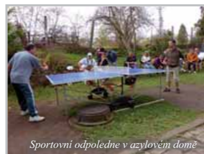
Sportovní odpoledne v azylovém domě

Kromě sociálních služeb vyvíjí FCH Litoměřice i další činnosti. Realizovala projekty Podané ruce, Doplňkové vzdělávání zaměstnanců a v současné době končí projekt Integrace sociálně vyloučených skupin na trh práce v Litoměřicích. Kromě těchto velkých projektů má i další menší, zaměřené např. na prevenci, mládež a pomoc sociálně vyloučeným skupinám při začleňování do společnosti. Pořádá humanitární akce a zajišťuje pomoc při živelních pohromách. Také do budoucna plánuje realizaci dalších projektů.