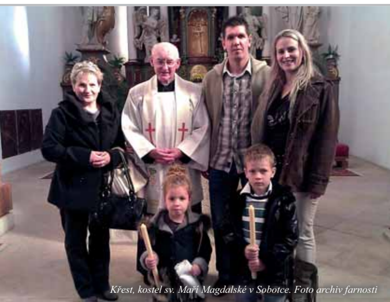
Křest, kostel sv. Maří Magdalské v Sobotce.