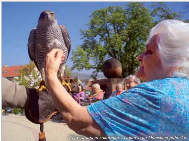
Při vystoupení sokolníků v Domově na Dómském pahorku

Dnes vám představujeme činnost Farní charity Litoměřice (dále jen FCH Litoměřice), která je jednou z dvanácti profesionálních charit působících v litoměřické diecézi.