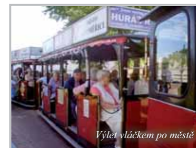
Výlet vláčkem po městě

Farní charita Litoměřice Zahradnická 1534/5, Litoměřice telefon: (+420) 417 770 000 e-mail: fchltn@fchltn.cz www.fchltn.cz