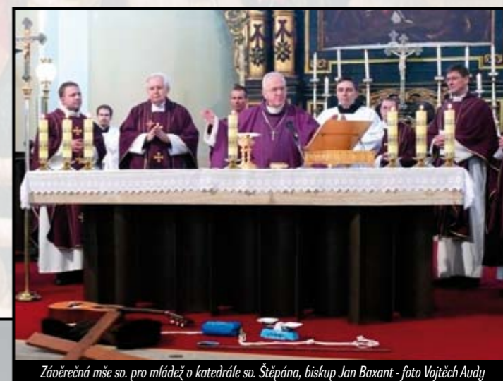
Závěrečná mše sv. pro mládež u katedrále sv. Štěpána, biskup Jan Baxant