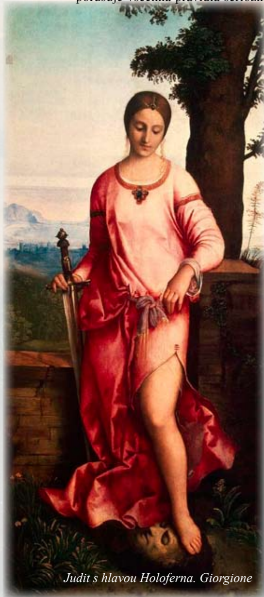
Judit s hlavou Holoferna. Giorgione