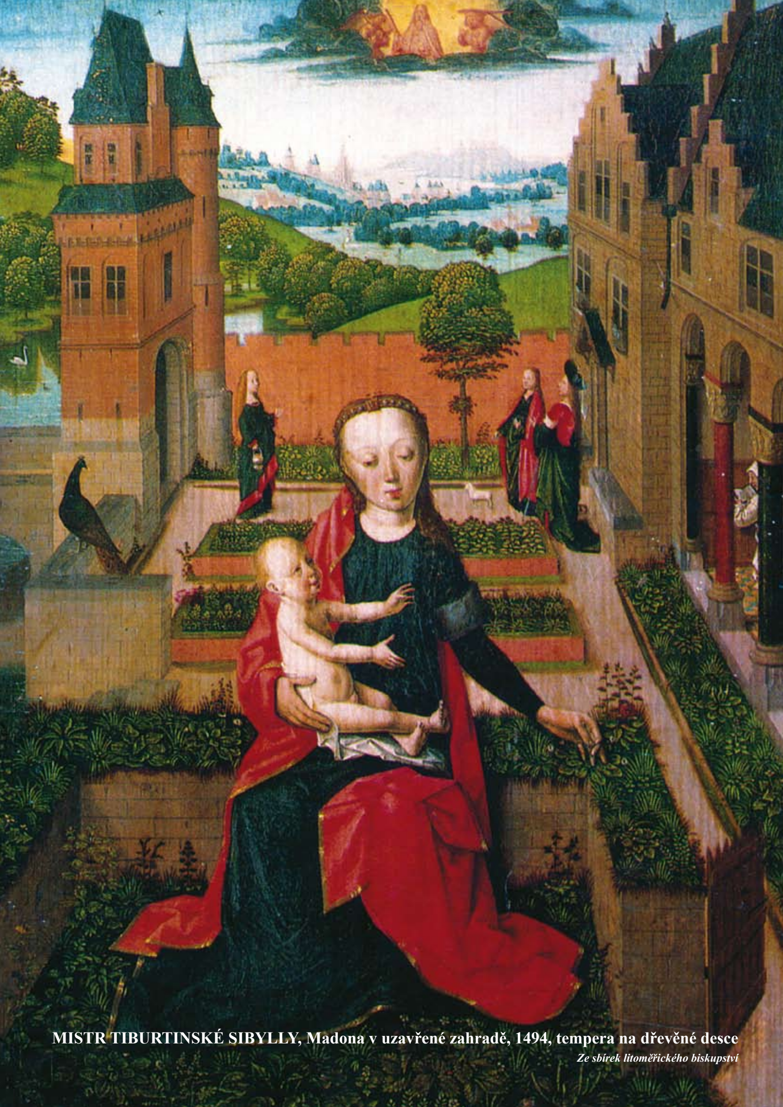
MISTR TIBURTINSKÉ SIBYLLY, Madona v uzavřené zahradě, 1494, tempera na dřevěné desce