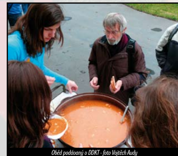
Oběd podávaný v DDKT

Fotogalerii Vojtěcha Audyho naleznete na http://tinyurl.com/zdislava1 a http://tinyurl.com/zdislava2