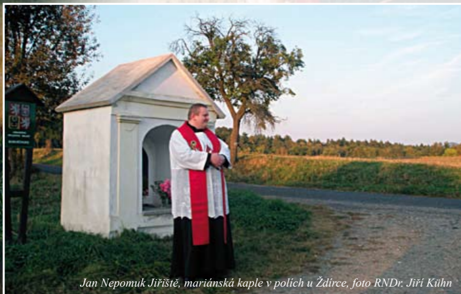
Jan Nepomuk Jiříště, mariánská kaple v polích u Ždírci

chtěli dozvědět něco, o čem ještě neslyšeli, pozval bych je do kostela sv. Jakuba v Bořejově. To je jeden z kostelů, který byl více než tři desítky let opuštěný. Když jsem ho dostal na starosti, převzal jsem ho jako skladiště, kde uvnitř byla jenom spoušť. Vyřezané obrazy z oltářů, vysekané výplně z kazateln, kostel sloužil jako skladiště všeho, co se snad možná ještě někdy mohlo, nebo nemuselo hodit. Byl obklopený neproniknutelně zarostlým hřbitovem. S pomocí dobrých lidí se nám podařilo nejenom tento kostel