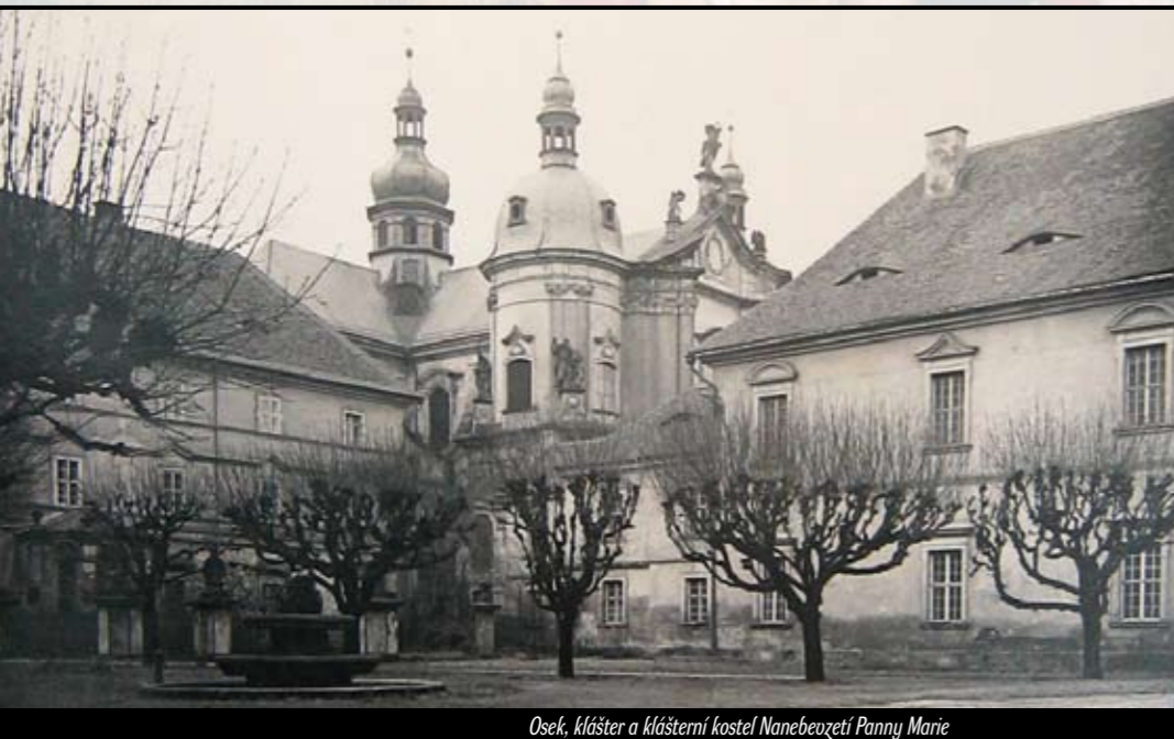
Osek, klášter a klášterní kostel Navštívení Panny Marie