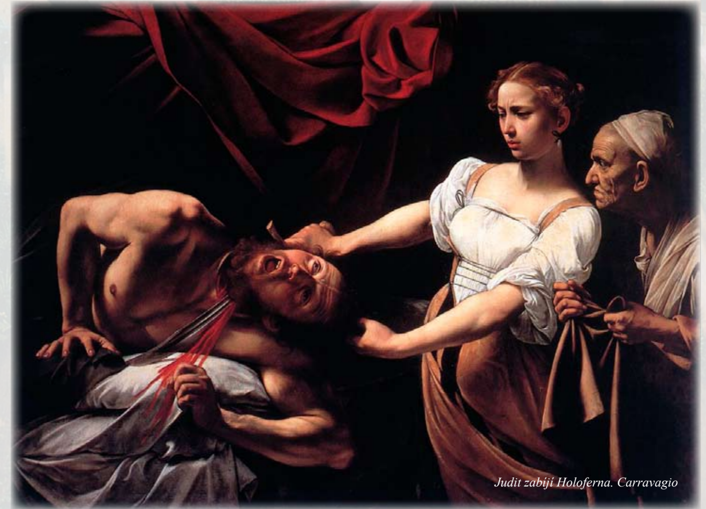
Judit zabíjí Holoferna. Carravaggio