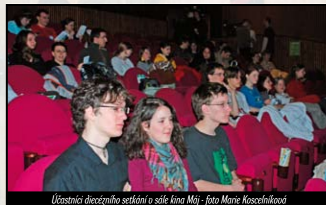
Účastníci diecézního setkání v sále kina Máj