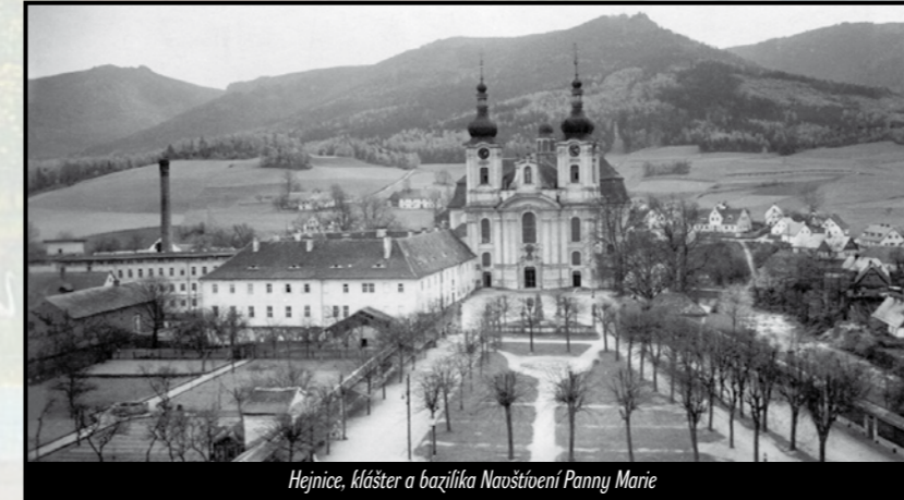
Hejnice, klášter a bazilika Navštívení Panny Marie

umístěno i přeškolovací středisko v České Kamenici. Politická školení byla určena zejména mladším kněžím. Školení měla za cíl přesvědčit řeholníky, aby vstoupili do duchovní správy na místa uprázdněná po diecézních kněžích, kterým byl odebrán státní souhlas nebo byli trestně stíháni. Stejně