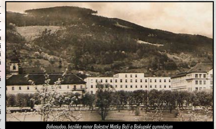
Bohosudov, bazilika minor Bolestné Matky Boží a Biskupské gymnázium

Autorka pracuje na katedře historie Fakulty přírodovědně-humanitní a pedagogické Technické univerzity v Liberci a současně v historickém oddělení Památkového úřadu v Terešíně. Zaměřená na retribuci a činnost mimořádných lidových soudů v českých zemích a perzekuce katolické církve v 50. letech.