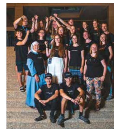
Přípravný tým Tvořivých dílen

To, co mi ovšem přišlo na celém programu nejlepší, byl koncept diskusních skupinek, kde byli účastníci rozděleni do skupin napříč diecézemi a ve kterých se diskutovalo na téma katechezí, které byly součástí ranního programu. Bylo totiž velice příjemné a obohacující slyšet, jak věci prožívají lidé stejného věku z úplně jiných konců republiky, jaké mají názory na různá duchovní témata a že jsou tak schopni naslouchat a sdílet se, aniž by soudili druhé za jejich názory. Já sám jsem byl animátorem jedné tako-