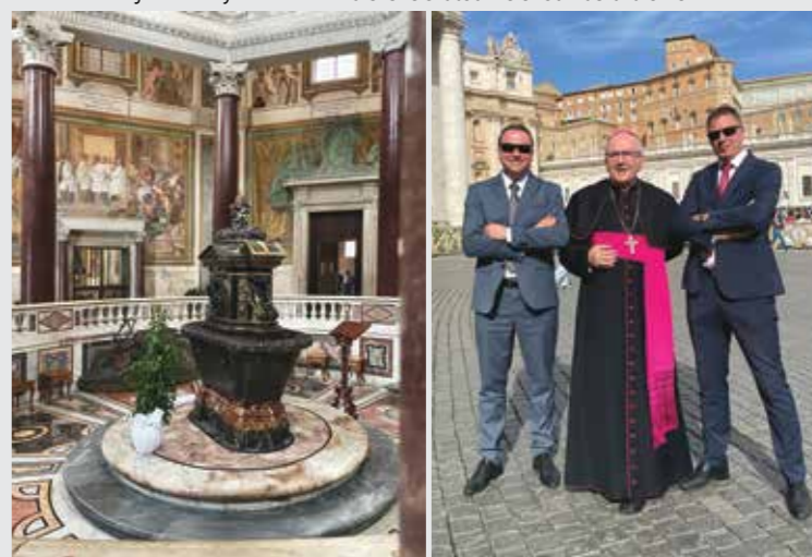
Baptisterium na Lateránu