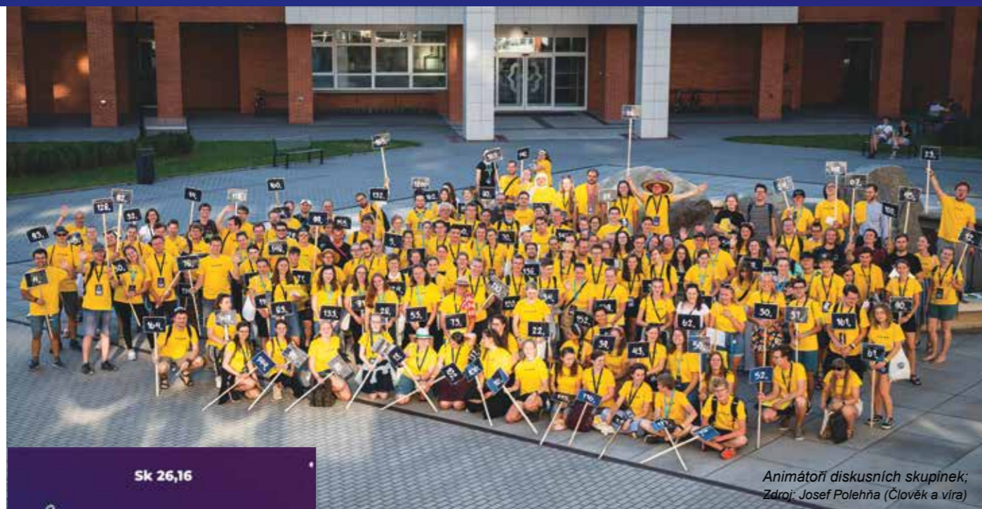
Animátoři diskusních skupinek; Zdroj: Josef Polehňa (Člověk a víra)