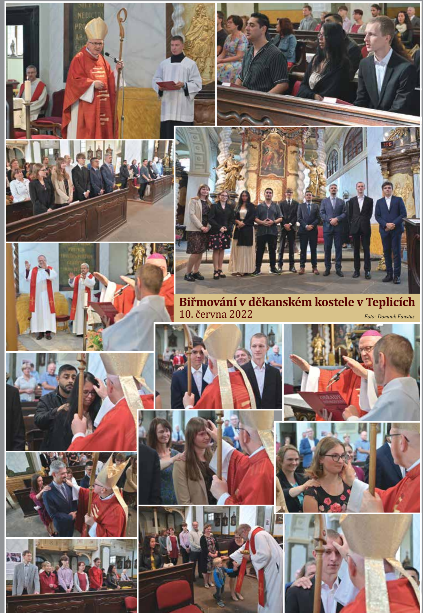
Biřmování v děkanském kostele v Teplicích 10. června 2022

Nevyžádané příspěvky nevracíme. Redakce si vyhrazuje právo na neuveřejnění nebo zkrácení příspěvků. Registrace MKČR E7397. ISSN 1211-3042 © Biskupství litoměřické