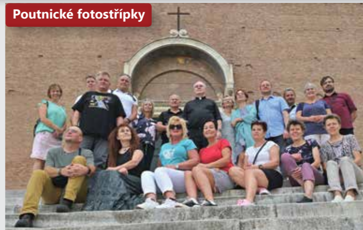
Poutníci z litoměřické diecéze společně navštívili baziliku Santa Maria in Aracoeli