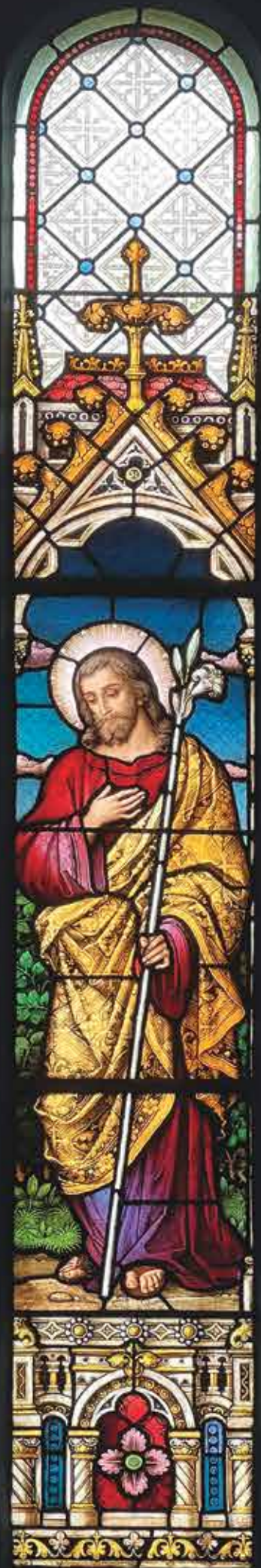
Okenní vitráže s vyobrazením Svaté rodiny, kaple Božského srdce Páně v Jiříkově