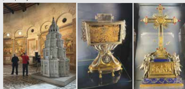
Starobylá bazilika sv. Štěpána na kopci Celian se zajímavou výmalbou