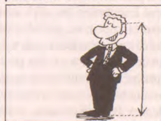
B Od paty k hlavě.