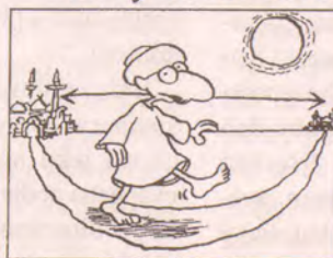
A Z Mekky do Mediny.