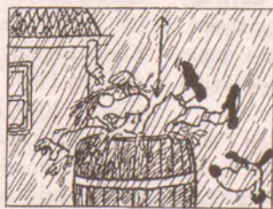
C Z lijáku pod okap.