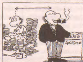
D Od chudáka k boháči.