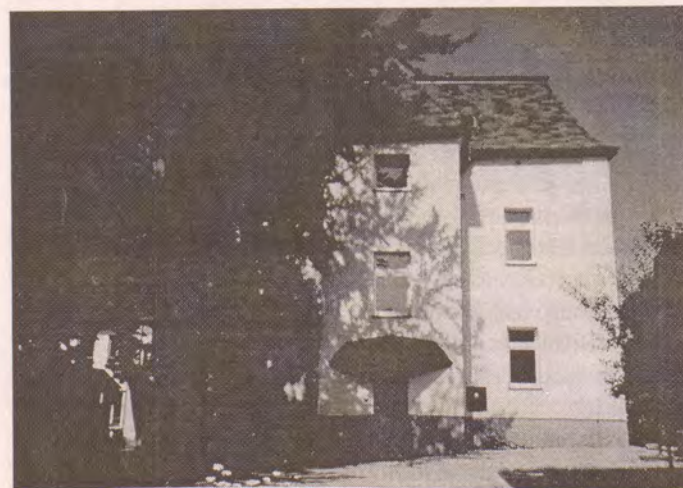
Strážská fara, kde nyní členky institutu bydlí