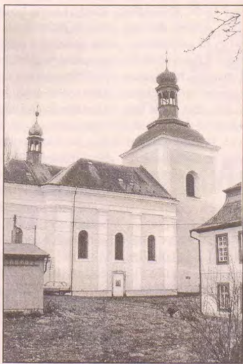
Děkanský kostel sv. Mikuláše v Turnově