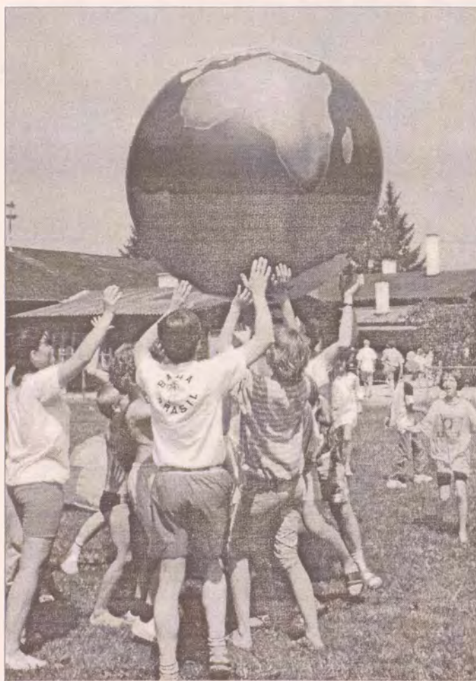
„Osud této země bude jednou v rukou našich dětí“ - jedna z fotografií výstavy.

Ivan Dobrovolský je po starší klidný muž, dlouholetý