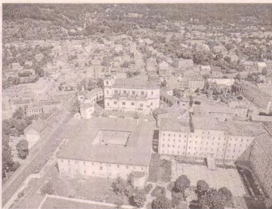
Bohosudovské biskupské gymnázium