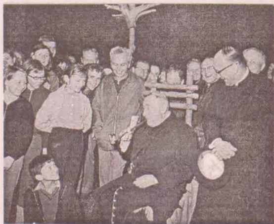
Kardinál Trochta měl zvláště blízko k dětem