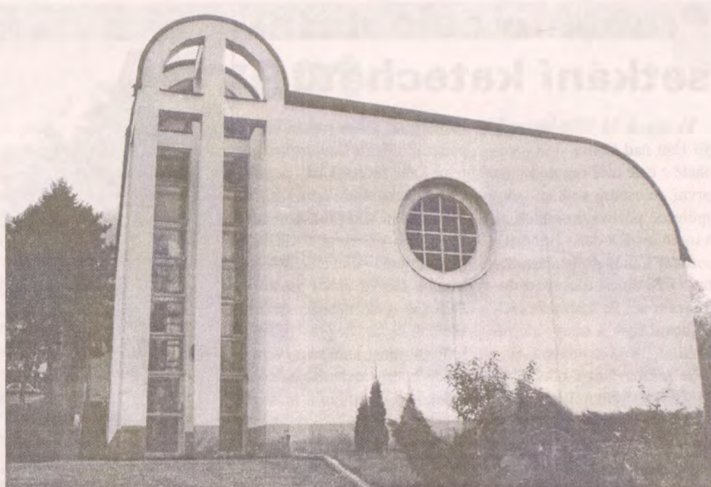
Kostel sv. Václava

Lidé, kteří přicházejí do kostela, nejsou ani zdale-