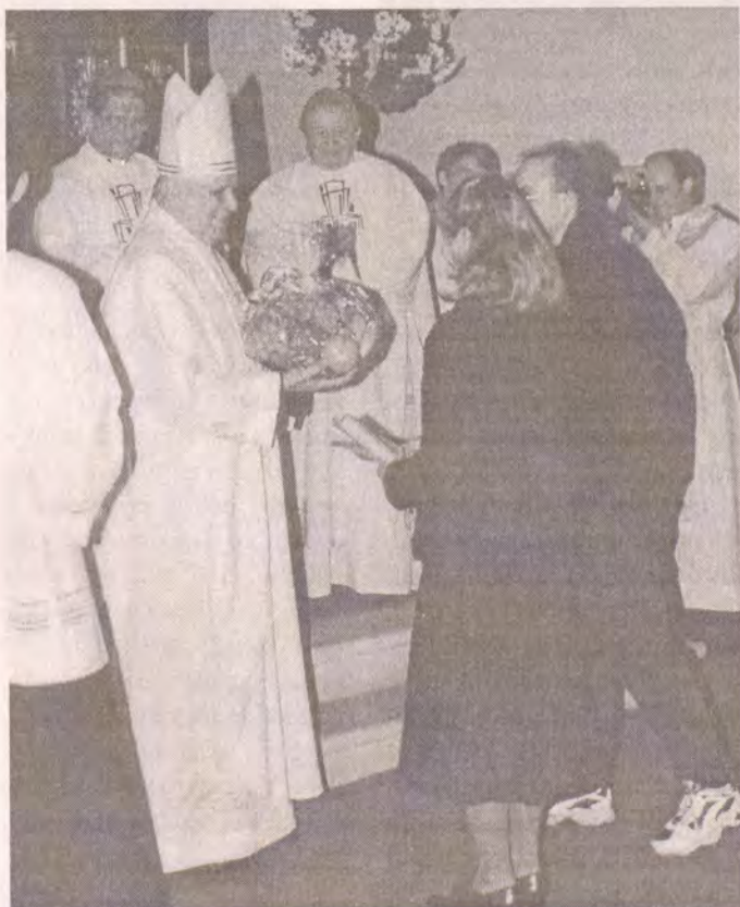
Gratulují a ovocný dar předávají zástupci litoměřické mládeže