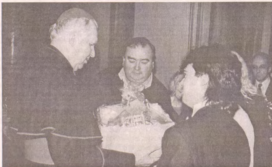
Otec biskup přijímá gratulace jednotlivců i zástupců farností

S velikou radostí jsem se zúčastnil této děkovné mše svaté u příležitosti vašich sedmdesátých narozenin. Mohl