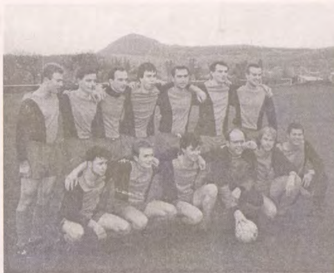
Mužstvo litoměřického Teologického konviktu

Ve druhém poločase byli jednoznačně lepší fotbalisté konviktu a jejich vítězství zadržela jen obrovská smůla, když nastřelili dvě tyče a neproměnili tři pokutové kopy. Konečný výsledek 4:3 ve prospěch bohoslovců z Prahy není pro konvikt prohrou, neboť všichni z pražské fakulty jsou jeho odchovanci. Už nyní se všichni těší na jarní odvetu, která bude opět v Litoměřicích.