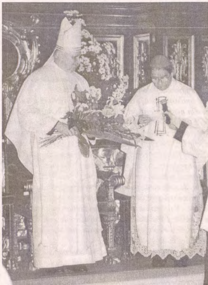
Apoštolský nuncius Giovanni Coppa přednáší své blahopřání

ním přišla chvíle pro gratulanty. Prvním byl otec kardinál