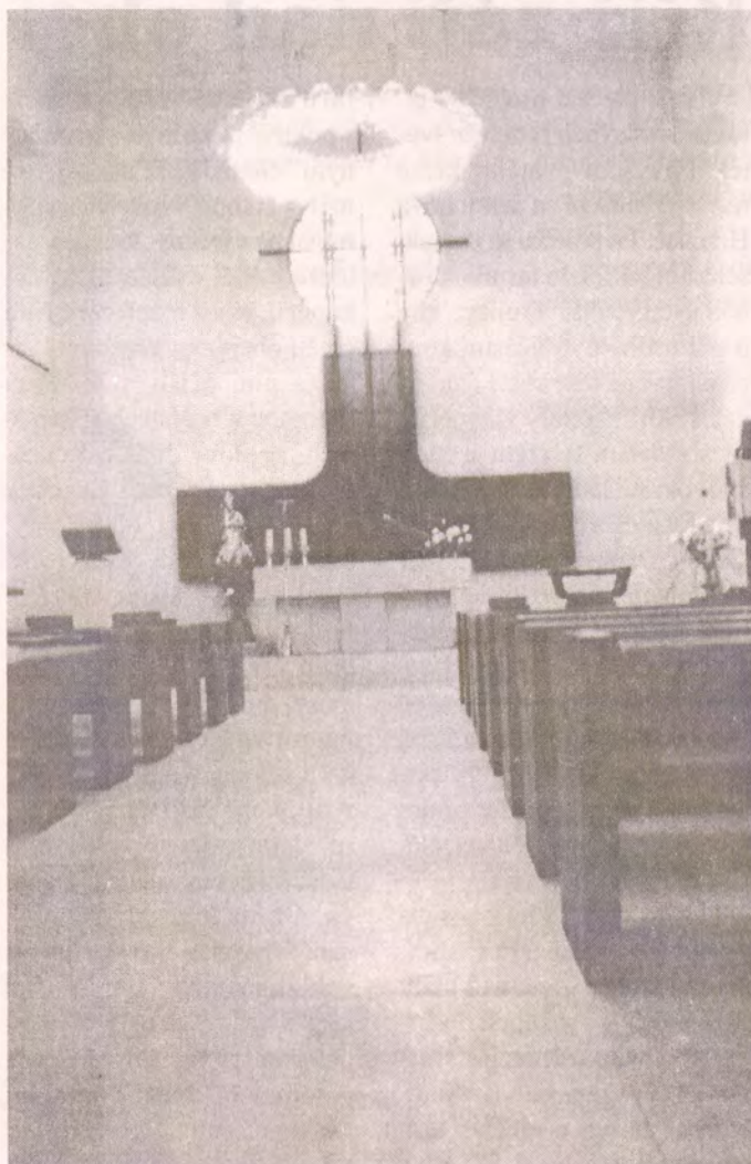
Moderní interiér svatováclavského kostela v Mostě