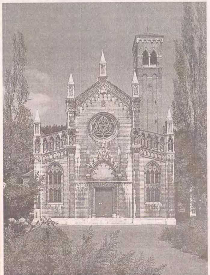
Kostel Neposkvrněného početí Panny Marie v Dubí